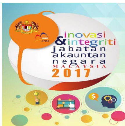
Pemenang Tempat Ketiga