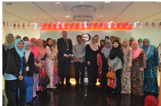
Lawatan Inovasi Ke KPJ Healthcare Bhd