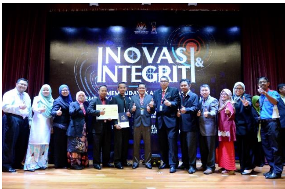
Pemenang Tempat Kedua