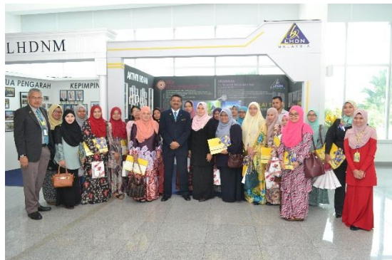
Lawatan Inovasi Ke LHDN Cyberjaya

Lawatan ini bertujuan mendapatkan pendedahan dan perkongsian ilmu terutamanya dalam etika kerja dan budaya inovasi yang diterapkan dalam organisasi ini sekaligus melayakkan mereka menerima anugerah berkaitan inovasi.