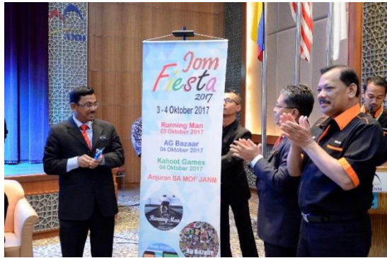
Majlis Perasmian Jom Fiesta 2017 Oleh YBhg. Dato' ANM