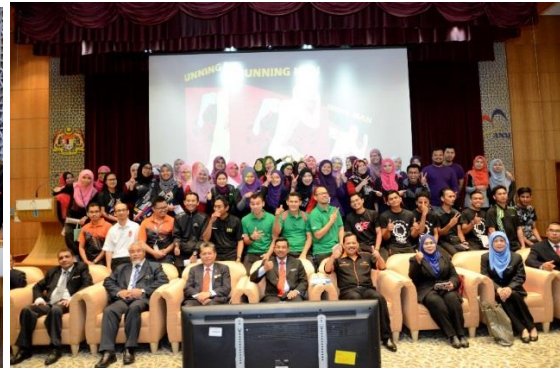
Para Peserta Jom Fiesta 2017 Bergambar Bersama Pengurusan Tertinggi JANM