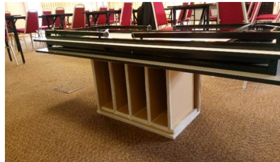
Hasil Ciptaan Perabot