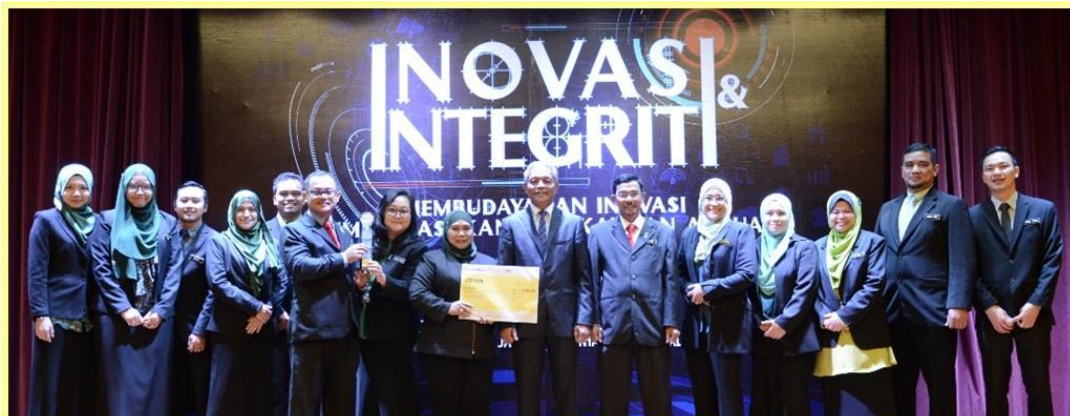
Johan Konvensyen KIK JANM 2017