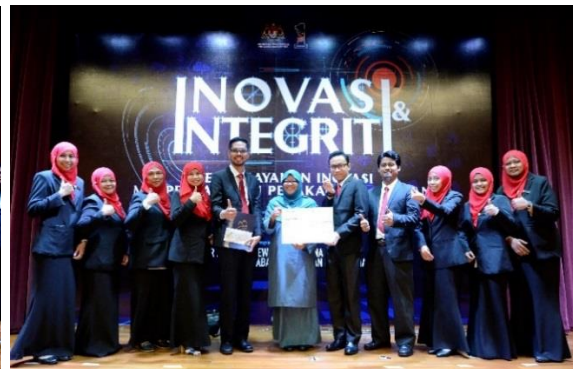
Pemenang Tempat Ketiga