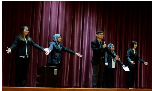
Pembentangan Daripada Kumpulan Yang Bertanding