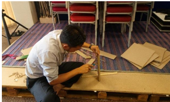
Proses Pembinaan Perabot Menggunakan Kadbod

Demo Inovasi Kadbod dijalankan bersama dengan Kahoot Stairs Challenge Siri 2 pada 21 Disember 2017 bagi mencungkil kreativiti warga JANM dalam menghasilkan peralatan pejabat daripada kadbod dan barangan terpakai. Hasil ciptaan telah dipamerkan semasa Perhimpunan Bulanan JANM bulan Disember 2017.