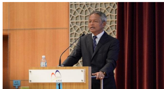
Ucapan Perasmian Oleh YB. Timbalan Menteri Kewangan I