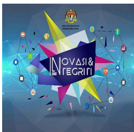
Pemenang Tempat Kedua